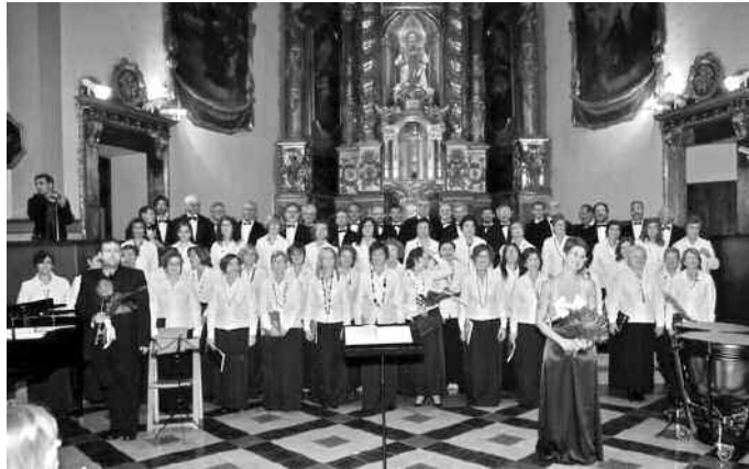
El Cor de Mestres Cantaires, en una de sus actuaciones