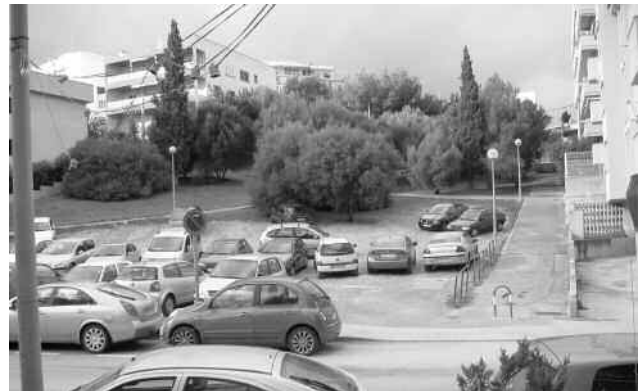
Solar junto a la Caixa rural, aparcamiento provisional

Es evidente que por cuestiones presupuestarias resulta imposible acometer de una vez todos los desperfectos y carencias que tuvimos ocasión de comentar pero parece que hay voluntad de solucionar algunos de los problemas que le presentamos. Esperamos que sea en breve. Les tendremos informados al respecto.