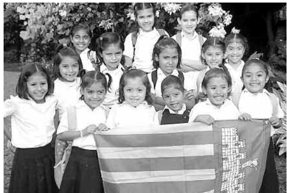
Un grupo de niñas del Hogar infantil Ciutat de Palma, construido en 2003.