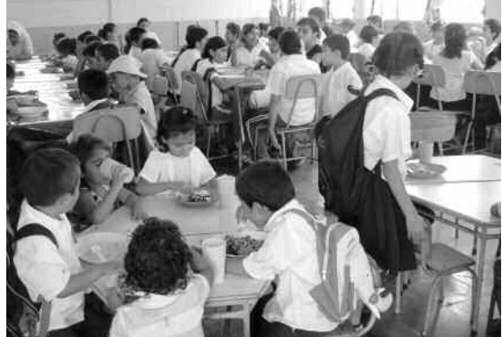
Niños becados por familias mallorquinas en el comedor Ntra. Señora de Guadalupe, en Bello Amanecer (Nicaragua)