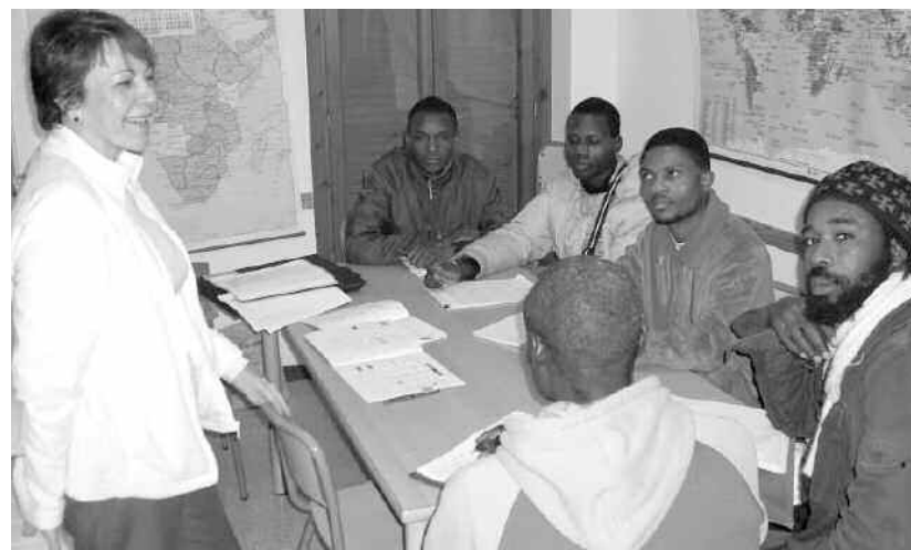
Ascensión en una clase del nivel intermedio