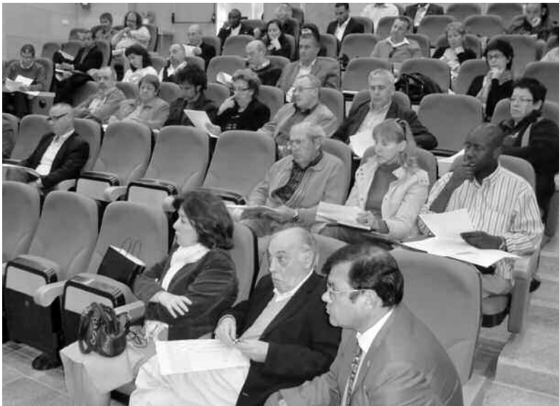
Miembros del Fòrum reunidos en Pleno

escrupulosamente la ley, así como la responsabilidad que les incumbe de garantizar los derechos básicos a todas las personas y en generar en el conjunto de la población actitudes tolerantes y positivas hacia las personas de orígenes diferentes, entre ellas las extranjeras.